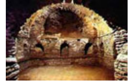
Termas de Lugo

1. Termas: Construcción arquitectónica consistente en unos baños públicos. Constan de las siguientes partes: baños fríos (frigidarium), templados (tepidarium), de vapor (caldarium), dependencias para desnudarse (apoditerium) y otras salas. Eran también lugares de reunión. Las más famosas son las de Caracalla en Roma.