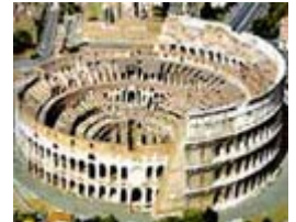
El Coliseo (Roma)

3. Anfiteatro: Edificio público para espectáculos (luchas entre gladiadores y animales). Tiene planta ovalada con gradas (cavea) en torno a la arena donde tenían lugar los combates. El más famoso es el Coliseo de Roma (siglo I), mandado construir por los emperadores Flavios (Vespasiano y su hijo Tito). Tiene capacidad para 50.000 espectadores.